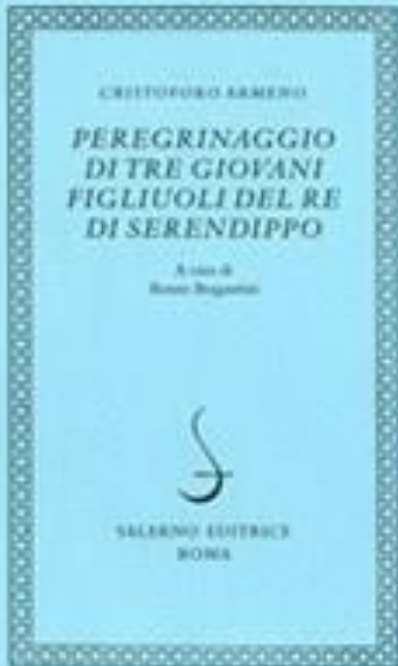
Cristoforo Armeno (1548)

Oltre a essere indicata come sensazione, la serendipità indica anche un tipico elemento della ricerca scientifica, quando spesso scoperte importanti avvengono mentre si stava ricercando altro, ma è anche frutto dell'acutezza di spirito e della capacità di osservazione del ricercatore.